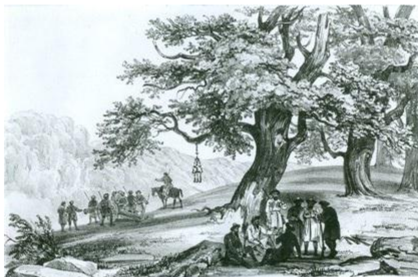
ANCIENNE CHAÎNE SUSPENDUE SUR LES HAUTEURS DE LA MOUNT

В героическом эпосе абхазов богатырь Нарджхёу застаёт двух братьев, которые никак не могут поделить унаследованную от отца очажную цепь. Нарджхёу рвет пополам эту цепь и дает каждому по половине 3 . Когда абхазы хотят подчеркнуть единокровность братьев, прибегают к определению: