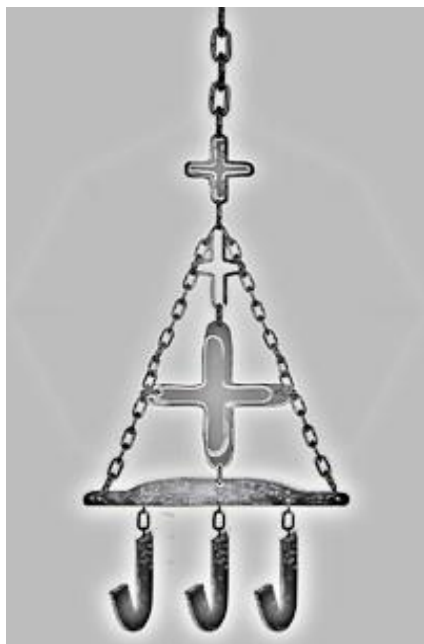
Молельная цепь - Архышчна родовая святыня князей Аубла

Аубла. Абхазский княжеский род. Владетели прибрежной земли в западной части исторической Абхазии между мамыским хребтом и р. Хостой (центральный район современного Б. Сочи).